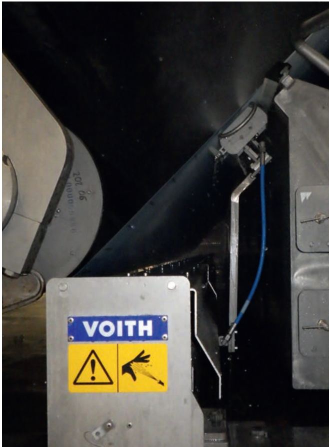
Formiersiebreiniger im Betrieb