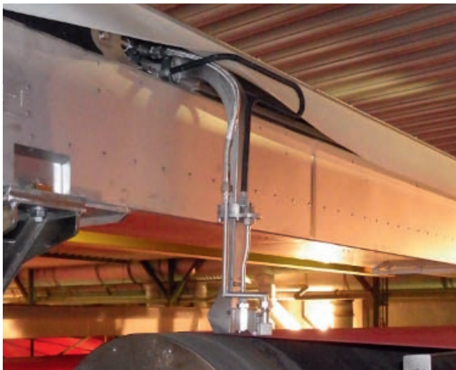
Trockensiebreiniger im Betrieb